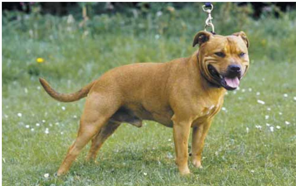
Staffordshire bull terrier