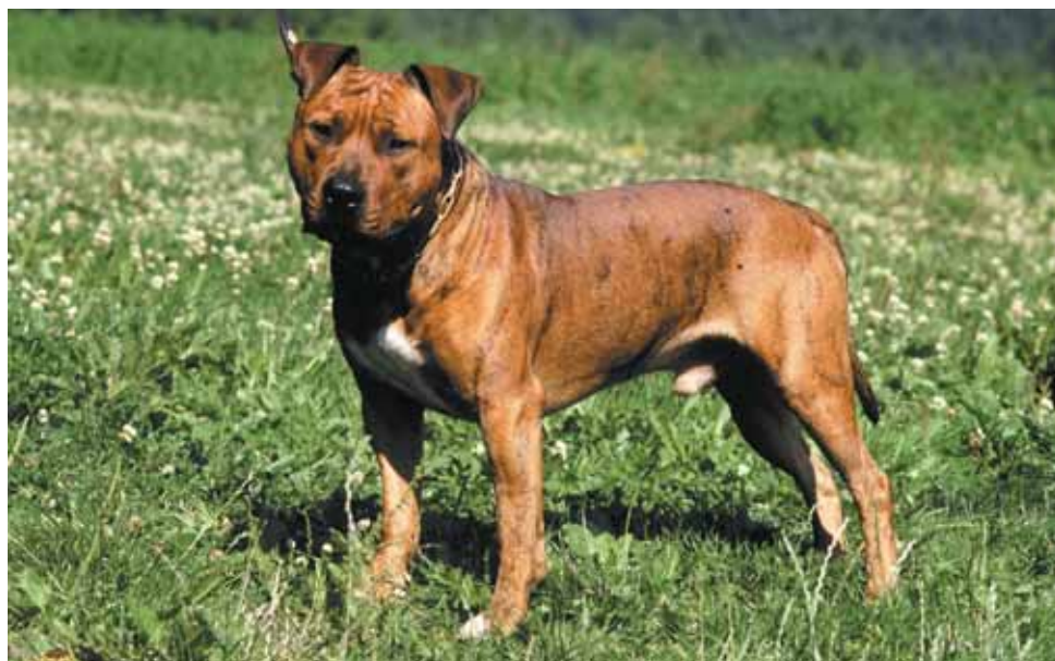
Amerikansk staffordshire terrier