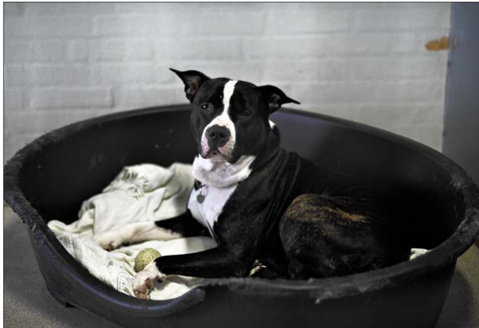
Hunden Rex er en blanding af amerikansk bulldog og en amerikansk staffordshire terrier og må derfor ikke få et nyt hjem. I øjeblikket er det uvist, om han tvinges til aflivning.