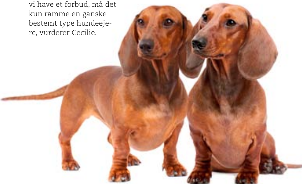
Gravhunden er skyld i 16 procent af alle hundebid. Skal den så tvinges til at have mundkurv på?