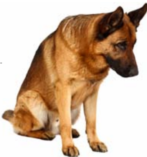
Schæferen er skyld i 33 procent af alle hundebid. Skal den så forbydes?

Den pointe understreges af, at politikerne også har overhørt den nærmest enstemmige melding fra